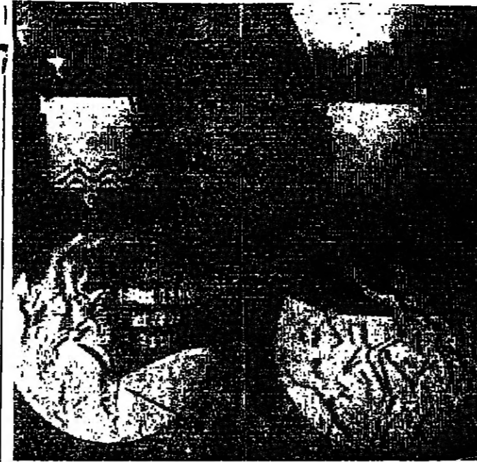
نولجان لوجهي المدافلة الذهبية لاوياد المكسيك ١٩٦٨ الذي يقام في مدينة مكسيكو خلال الشهر القادم

أخرج جيز الذي جرح وجرحه على بعد ان تحصن داخل منزله . وعرض جيز أمس إخراج أسرته من هنا يومه الرابع دون أن يظهر السلاح جون جيز الذي يبلغ الثامنة والعشرين أي قابل على استعداده للاستسلام . وبقي رجال البوليس الذين كسب بعضهم مسلحين اقتل طوال الليل تحت وجه الأتراء حيث يحتفظ جيز بزوجه وأخفائه الأربعة كرهائن . ولكن القدر بزع دون أية محاولة